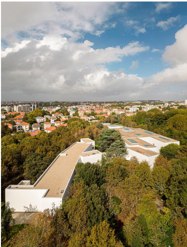
Foto Links Siza Wing Recht Museumgebouw uit 1999